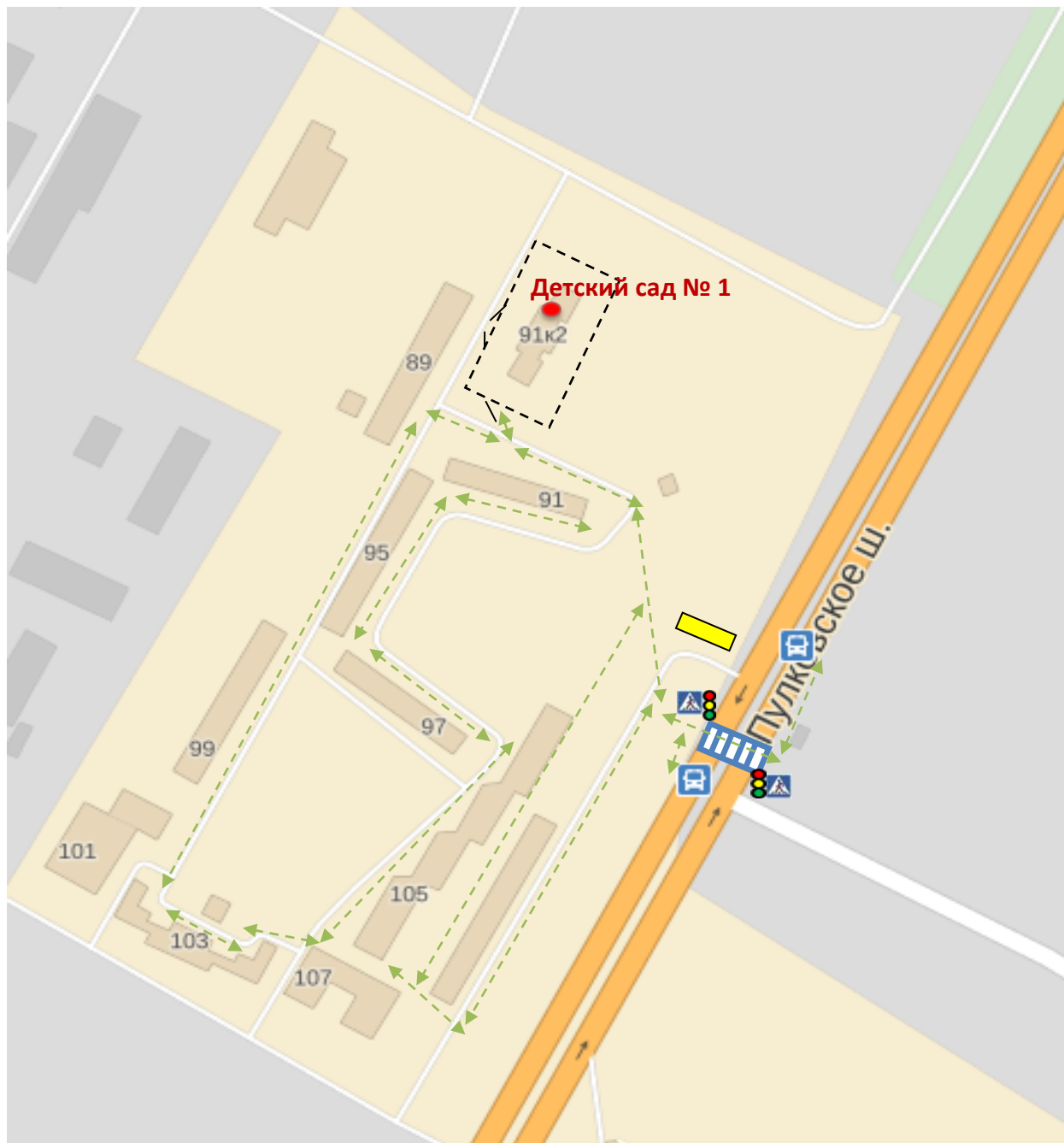
Схема организации дорожного движения в непосредственной близости от ГБДОУ детского сада № 1 (1-й корпус) с размещением соответствующих технических средств, маршрута движения детей и расположения парковочных мест